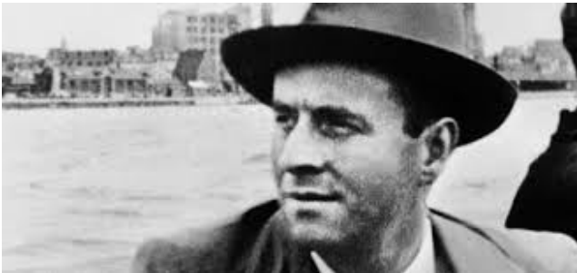
Filosoffen Hans Blumenberg (1920-1996)

Det har alle dage været svært at overbevise mere retlinede eksistenser om værdien af at tage en omvej. Morten Østergaards aktuelle studiefremdriftsreform, med dens krav om hurtigere gennemførelse af uddannelser og et stop for orlov, er blot den seneste og mest intensive version af en gammel mistanke: omveje er spild af tid.