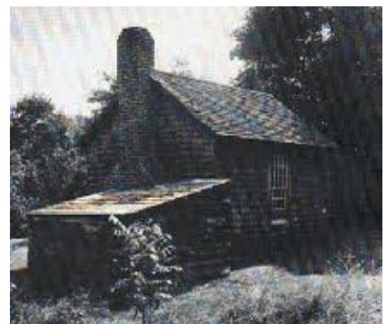
Henry David Thoreaus (1817-1862) hytte ved Waldensøen i Massachussetts. Det

Alt det her vidste Blumenberg udmærket. Han lancerede sine forestillinger om omvejen i direkte opposition til Descartes lille spejderråd: "Kun hvis vi slår ind på omveje, formår vi at eksistere", hed det dramatisk hos Blumenberg, der selv tyede til en lille anekdote for at forklare hvorfor vi kun kan eksistere, ja sågar overleve, ved at slå ind på en omvej. For mange hundrede år siden fortalte renæssancefilosoffen Michel de Montaigne en anekdote om den antikke konge Pyrrhus (fra hvem vi kender den tvivlsomme glæde ved en Pyrrhussejr) som Blumenberg valgte at gengive så han kunne stille os alle et spørgsmål om omveje.