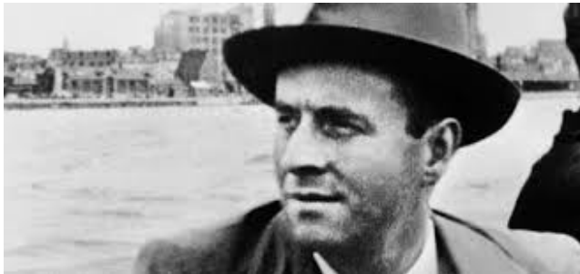
Filosoffen Hans Blumenberg (1920-1996)

Det har alle dage været svært at overbevise mere retlinede eksistenser om værdien af at tage en omvej. Morten Østergaards aktuelle studiefremdriftsreform, med dens krav om hurtigere gennemførelse af uddannelser og et stop for orlov, er blot den seneste og mest intensive version af en gammel mistanke: omveje er spild af tid.