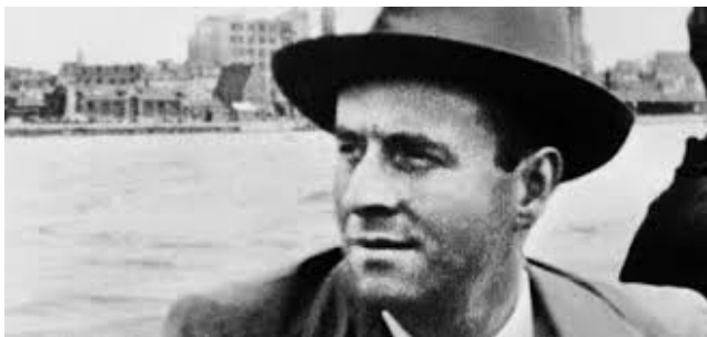
Filosoffen Hans Blumenberg (1920-1996)

Det har alle dage været svært at overbevise mere retlinede eksistenser om værdien af at tage en omvej. Morten Østergaards aktuelle studiefremdriftsreform, med dens krav om hurtigere gennemførelse af uddannelser og et stop for orlov, er blot den seneste og mest intensive version af en gammel mistanke: omveje er spild af tid.