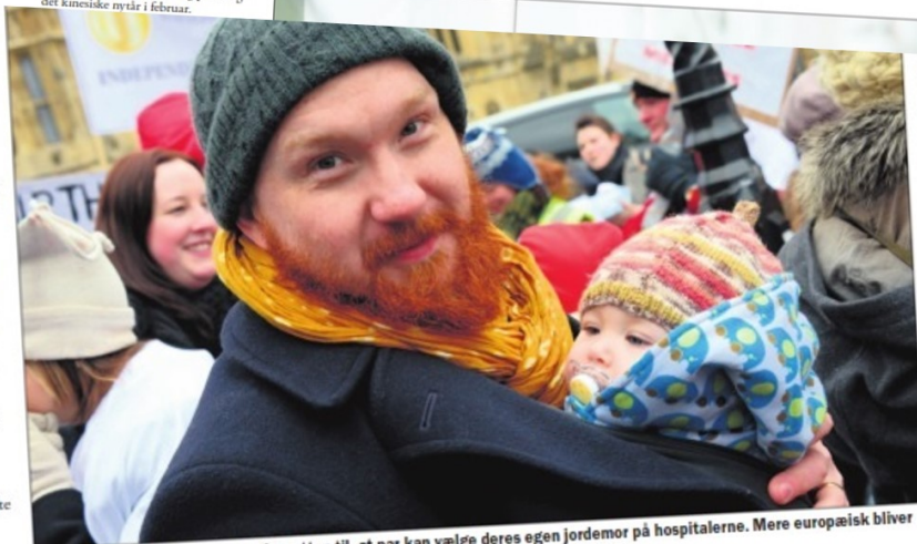
En far fra London demonstrerer for retten til, at par kan vælge deres egen jordemor på hospitalerne. Mere europæisk bliver det næppe.

Ramadan, den kristne jul og påske og det kinesiske nytår i februar.