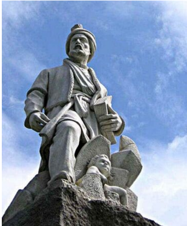
Abul Qasem Ferdousi (940-1020) er forfatteren til sagnhistorien Shahnameh

Ferdousi blev født 300 år efter de muslimske araberes erobring af Iran. I Khorasan havde befolkningen stadig formået mundtligt at bibeholde deres traditioner, kultur, sprog, religionen Zarathustra og historie, som langsomt var ved at gå i glemmebogen. Derfor satte han sig ned og skrev sagnhistorien Shahnameh (Kongebogen). I virkeligheden er Shahnameh fyldt med historier om konger som dræber deres sønner, royal hybris, magtarrogance, og ender med en klagesang om hvordan landet pga. kongernes uduelighed og svaghed faldt i hænderne på de muslimske arabere. Hans betydning for Iran kommer måske bedst til udtryk gennem et interview med en egyptisk journalist (Mohamed Hassanein Heikal, f. 1923) om hvorfor med islams ankomst til Egypten gik deres historie, kultur, civilisation og sprog i glemmebogen. Han svarede: "Det skyldtes, at vi ikke havde en Ferdousi."