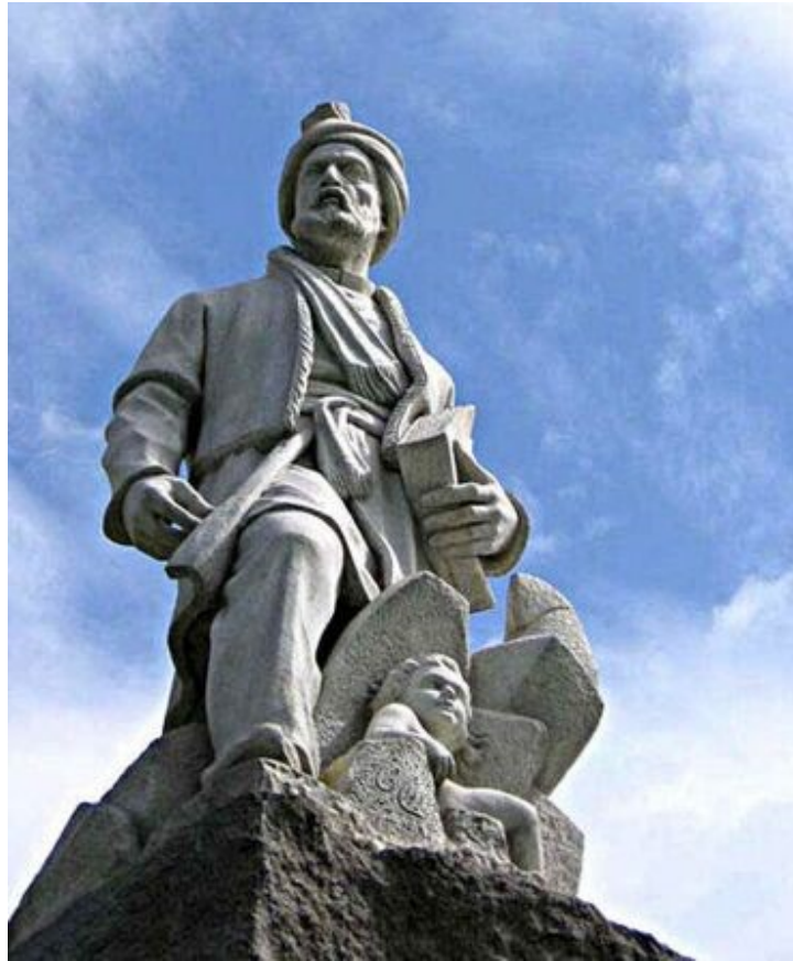
Abul Qasem Ferdousi (940-1020) er forfatteren til sagnhistorien Shahnameh

Ferdousi blev født 300 år efter de muslimske araberes erobring af Iran. I Khorasan havde befolkningen stadig formået mundtligt at bibeholde deres traditioner, kultur, sprog, religionen Zarathustra og historie, som langsomt var ved at gå i glemmebogen. Derfor satte han sig ned og skrev sagnhistorien Shahnameh (Kongebogen). I virkeligheden er Shahnameh fyldt med historier om konger som dræber deres sønner, royal hybris, magtarrogance, og ender med en klagesang om hvordan landet pga. kongernes uduelighed og svaghed faldt i hænderne på de muslimske arabere. Hans betydning for Iran kommer måske bedst til udtryk gennem et interview med en egyptisk journalist (Mohamed Hassanein Heikal, f. 1923) om hvorfor med islams ankomst til Egypten gik deres historie, kultur, civilisation og sprog i glemmebogen. Han svarede: "Det skyldtes, at vi ikke havde en Ferdousi."