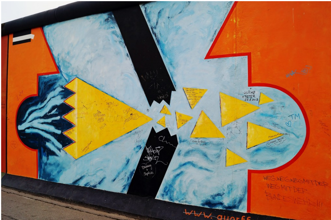
Udsnit fra "East Side Gallery", Berlinmuren.

Men årene er gået. De store varme krige er afløst af den kolde, Cubakrisen overstået, men snart skal gløderne blusse op i proxykrige rundt omkring på kloden. Kennedy holder sin store "Peace speech" i juni 1963 på American University og rejser kort efter til Irland, hvor han igen taler om denne fred, og om hvor vigtigt det er, at alle nationer – også de små – bakker om projektet.